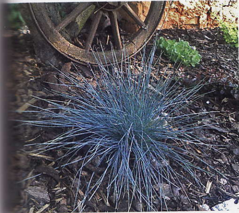
Kostřava sivá ( Festuca glauca )