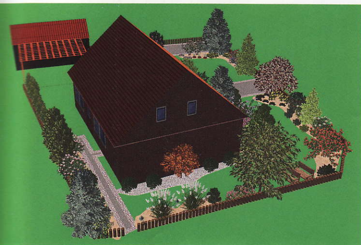
Celkový pohled ze západní strany