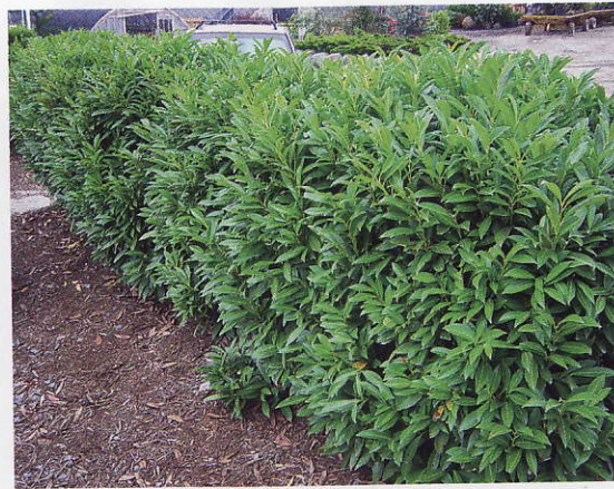
Bobkovišeň lékařská ( Prunus laurocerasus )

lilioflora 'Nigra'), umístěnou do volné plochy trávníku. Magnolie patří mezi jednu z nejnápadnějších a nejkrásnějších dřevin jara. Zajímavostí je, že kvetou před olistěním, tudíž vyniknou jejich výrazné velké květy. Do zatravněné plochy v okolí magnolie a dalších volných zatravněných ploch doporučila autorka návrhu vysadit kolekci různobarevných jarních cibulovin (narcisy,