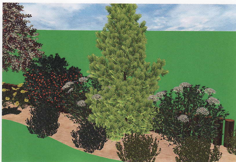
Nový záhon na jižní straně